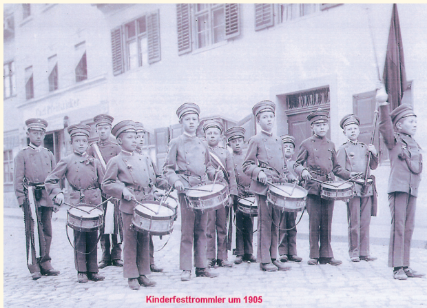
Kinderfesttrommler um 1905

Das Isnyer Kinder- und Heimatfest hat eine lange Geschichte, die bereits im Jahre 1620 beginnt. Es wird berichtet von etwa 100 Knaben, die mit „hiltzin Helleparten, item Bixen, brennenden Lunten, Trummen und Pfeiffen“ in der Stadt umherzogen und zuletzt auf den Rain marschierten. Die Tradition der Kinderfesttrommler hat man sich bis heute bewahrt. Der Weckruf um 5 Uhr morgens am Kinderfestsonntag treibt die Bewohner in der Stadt noch immer aus ihren Betten.